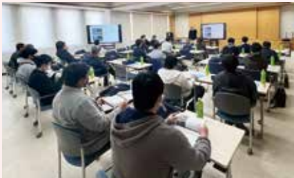
トプコン講習会の様子