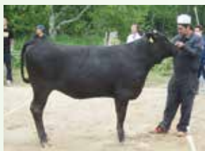
経産の部 ゆうさくら号