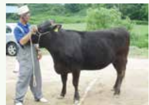
末経産の部 ひでみつ号