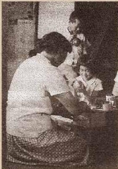
家庭薬を配置している風景

日本の家庭薬と共に歩んできた「JA配置薬」は、これからも健康で豊かな暮らしを応援していきます。