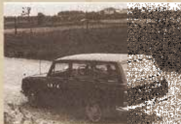
普及推進のため農村に行くクミアイ家庭薬車