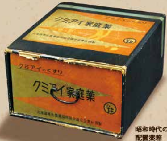
昭和時代の 配置薬箱